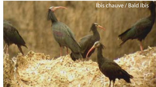
Ibis chauve / Bald Ibis