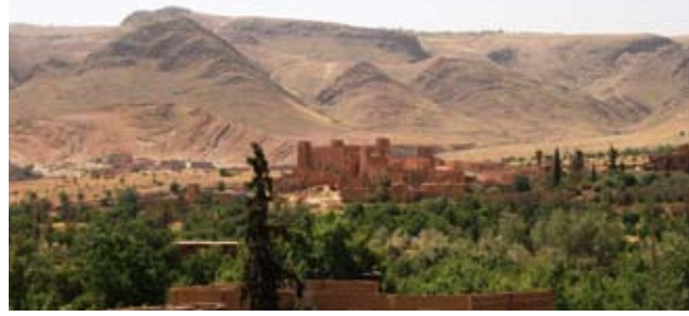
Vue panoramique de la Kasbah de Talouine / Kasbah Talouine panoramic view